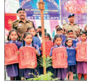
गैजनेपुर