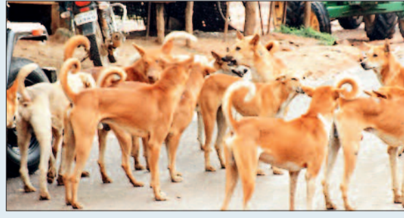
गली-मोहल्लों से लेकर बस स्टैंड तक झुंड का कब्जा